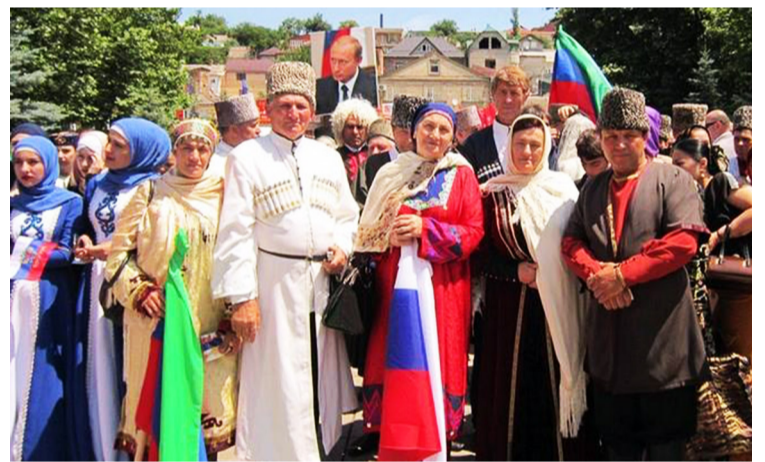
гъеб культуралул ва хлухъбахъиялул паркалда.

Гъеб табдир Тобитлана Махлалхъалаялда, Ленинилаб комсомолалул цларалда бу-