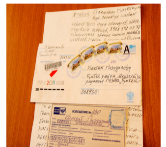
МагIарул мацI лъаларев чи магIарулав гуро