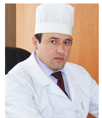
Унтаразул ва холезул къадар дагълъана