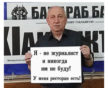
ГъадигIан инжитго данде гъабураб Дуниялъул бокIи бакъанго гуро