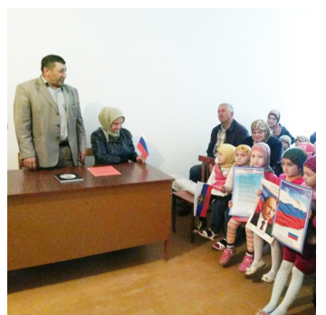
Россиялъ дунялалда рацалъи ва рекъел цIунулел руго