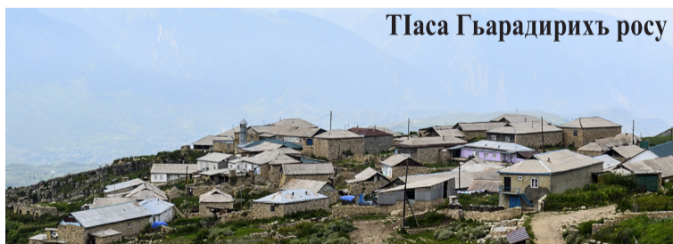
Таса Гъарадирихъ росу