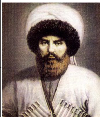
ЧIиркъатIа - Имаматалъул тахшагъар

Ахиралда хIукмуги къабул гъабуна. (Данделъиялъул материал гIатIидго хадуб къезе буго). Къурмагъиз ХIадисова