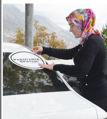
Россиялъул БахIарчи МухIамад НурбахIандовасул васият