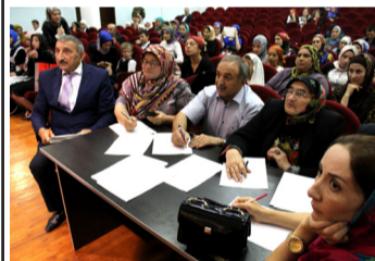
Гъелъ гурищ къункъраби роржулеб мехалъ, Къваридго зобалахъ ралагъулел ниль...