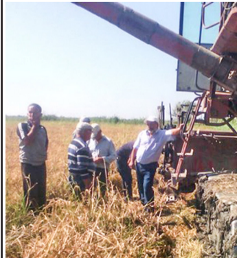
ПиринчI бакIарулеб буго «Данухский» СПКялда