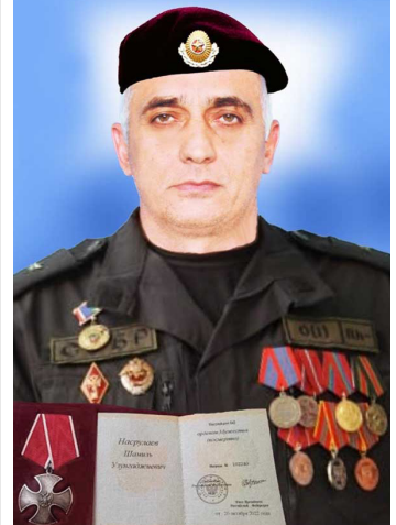
Бахарзал холаро, нилгер рекелъ руклуна даим - 2 гьум.