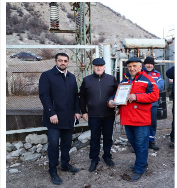
Игъали росулъ цияб трансформатор лъуна - 2 - гьум.