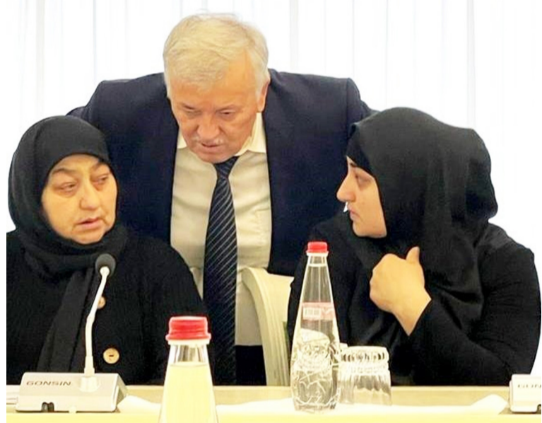
хъизамалгун. Регионалълул нухмалъулес гъваридаб паш-рекъон, улкаялълул тІалабал тІуралаго, Гумруялдаса