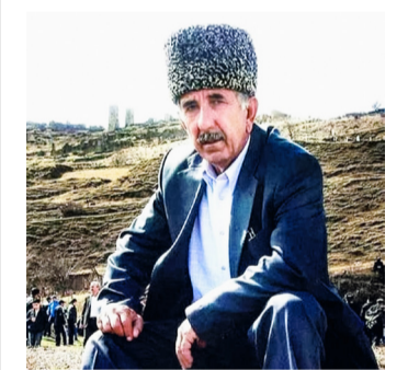
Ибрагъим Ибрагъимовасе - пачалихъияб шапакъат