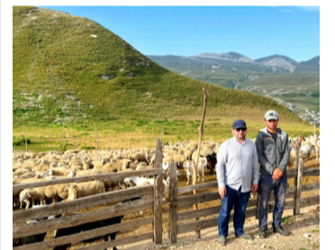
2022-абилеб соналъ картошка бекъаразул къадар цIикIкIана районалда