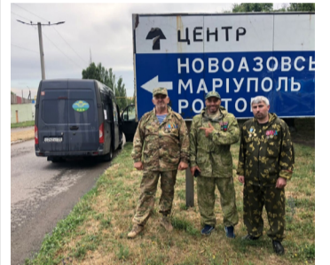
МухIамадрасул Сулеймановас Украинаялде сапар бухъана