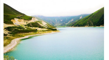
Балъгоялгун тIатарал балагъаздаса цIунаги