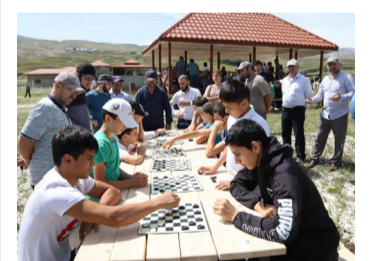
ЦIияб Сивухъ – шашкабазул ва шахматазул турнир