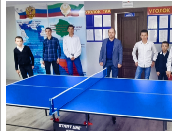
Гъалип Гъалиповас цIилкъадерил школалъе теннисалгъл стол сайгъат гъабунa - 2 гъум.