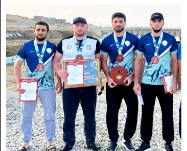
Республикалгълулаб волейболалгъл турниралда – 3-леб бакI - 2 гъум.