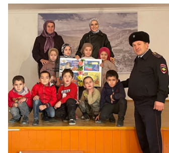
День сотрудника органов внутренних дел РФ отметили в Гумбете