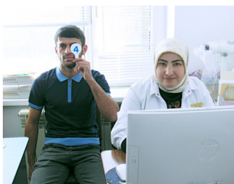
Армиялде ахIаразул 36-яс сахлъиялъул халгъабуна