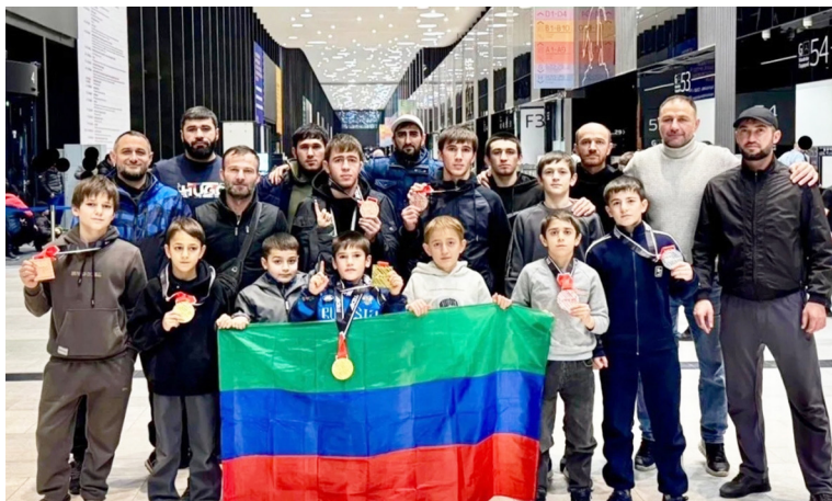
талъулги Гумруялъулги ЧIахIиял бергенлъаби.

Муниципалитеталъул бетIер Гъалип Гъалиповас ГIолохъанал спортсменазда баркана лъикIал хIасилаздалъун церерахъин ва гъарана спор-