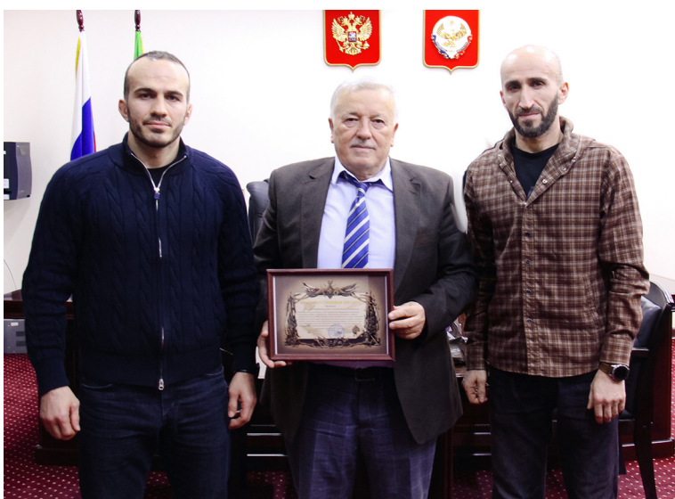
ул бетІер Гъалип Гъалиповасе ГІалихан ДавудхІажиевасе. ва районълул депутатазул Со- Гъалип Гъалиповас ВатІан браниялълул председатель цІунулезе баркала кьуна гъе-

Данделгиялда рагъулал хъулхъачагІаз баркала загъир гъабуна хасаб рагъулаб операциялълул мухъалде гуманитарияб кумек битІаралълухъ районълул нухмалгиялге ва сахаватчагІазе, кІвар бусси-набуна цебесеб кьерда ругел рагъухъабазе кумек гъабиялълул бугеб кІваралде. Гъединго гъез рагъулаб часталълул командованиялълул рахъалдасан баркала-ялълул кагътал кьуна районъл-