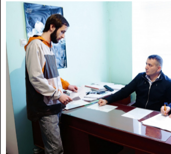
Армиялде ахIаразул сахлъиялъул халгъабуна - 2 гъум.