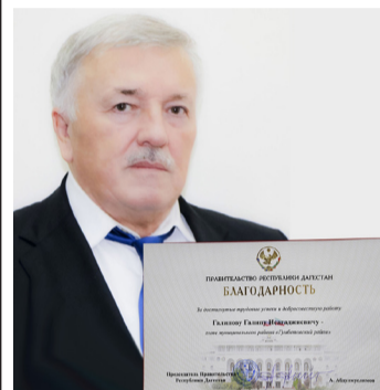
Гъалип Гъалиповасе – Дагъистаналъул ХIукуматалъул Баркалайлъул кагъат - 2 гъум.