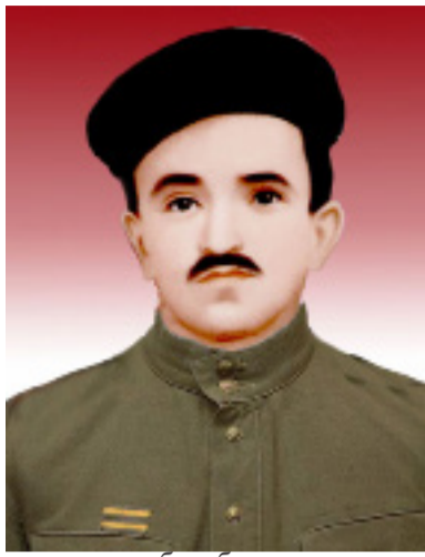
газета къабулеб машина кве-ралъ сверулев чилъун. ХІажи Гумруялдаса ватІалъана 1968.

Ругъунлъабаздаса хадув фронталде витІана ва лебал-го вагъана тушманасда дан-де. Бергенли босун хадув гІадвуссана рокъове. Хъу-таналде гочана хъизангун. ХІалтІана росдал магІишат цебетІезабиялда. ЦІидасан магІарухъе вачІана 1965 со-наль. Гъенивги колхозал-да хІалтІана. Цо заманалда хІалтІулев вукІана районь-ул «Гумбеталзул колхозчи»