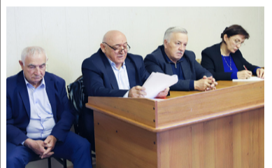
Минздравалълъул вакилзаби – Бакълъул мухъалда