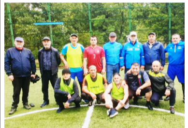
Рагъулал лъугъабакъиназул ветераназул сахлъи борхизаби