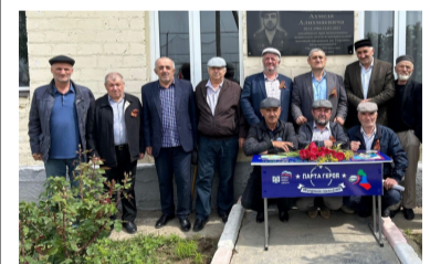
СВОялдаса тІадвуссинчІев АхІмад МухІамадовасул хІурматалда – мини-футболълъул рахъалъ турнир