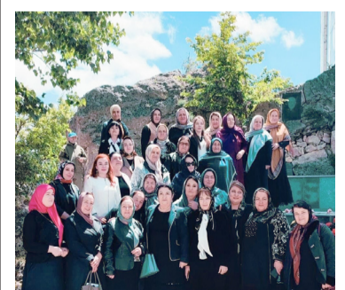
Гъуниб: руччабазул форум