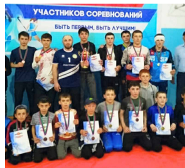
116 цїалдохъан гїахьаллгъараб кьєц