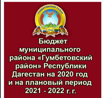
Собрание депутатов МР «Гумбетовский район»