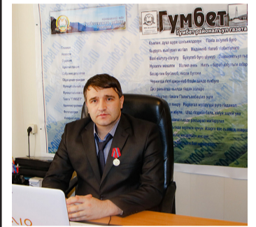
Медиагруппа «Гумбет»: в центре событий