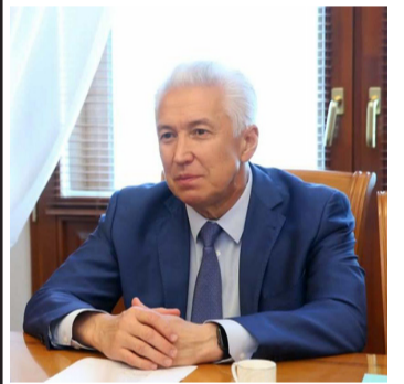
Владимир Васильев прокомментировал Послание Президента РФ Федеральному Собранию