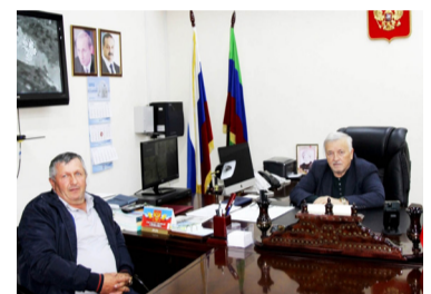
Гъалип Гъалиповас МухИмад МухИмадсагитов къабул гъавуна