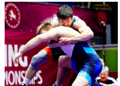
Игъалиса МухИмад МуртазагIалиевасул чIел