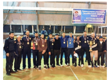
Магъди Юсуповасул цIаралда – волейболълул турнир