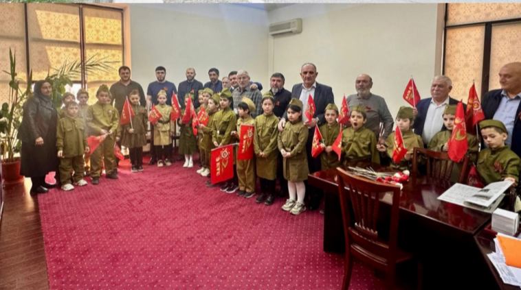
матаб даражаялда тІоритІизе хІаракат бахъана бакълъулаз. «Гумбет» информациялъулаб гІуцІи