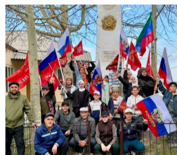
Ватан цIунарал ракIалда руго