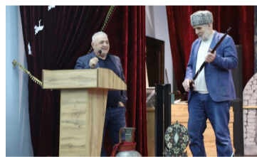
МухIамадрасул ШайхмухIамадовасул фильм бихъизабуна