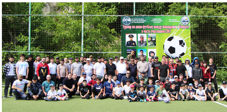
«Мангал» командаялъе. Турнир рагъиялъул ва шапакъ-атал къеялъул гІахъаллъи гъабун бакълъулазул спорталъул, туризмалъ-

Кинабниги турниралда гІахъаллъи гъабун микъго командаялъ. ТІоцебесеб бакІ босана ва кубокалъе мустахІиклъана «Кизилюрт» команда, кІиабилеб бакІ ккуна «ТІярата-1» командаялъ, лъабабилеб бакІ швана