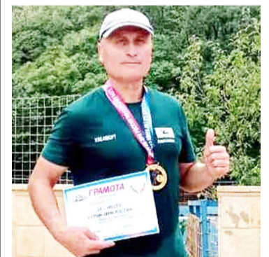
ХІосейн Лабазановасул чІел