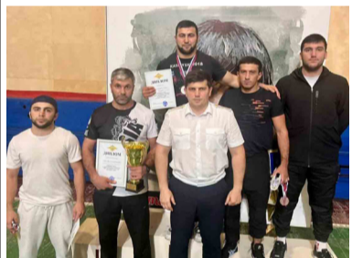
Рагъулаб самбоялълул рахълъ гъунар бихъизабуна