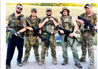
СВОялълул рагъухъабаз салам битІулеб буго ракъцоязде