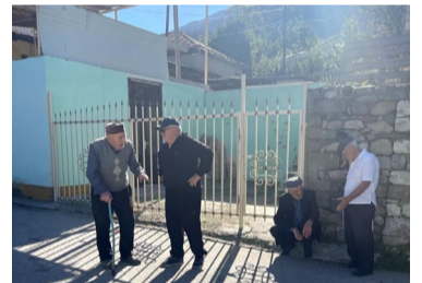
Игъалиб къо къачIазе – 200 000 гъуруц