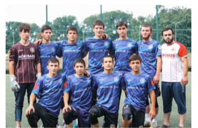
Бакълъулаз футболалъул рахъалъ гъунар бихъизабун