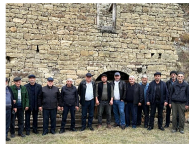
Гъадариб: лъел гъобо рагъана