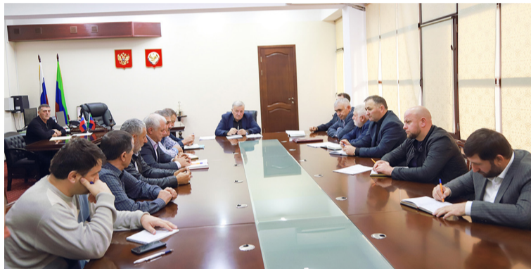
Тадкъаялги къуна гъес.

Бакълъул районалъул администрациялда муниципалитеталъул бетер Гъалип Гъалиповасул нухмалъиялда налогал ракъариялъул хласилал лъиклъизариялъул ва цогидал къвар бугел суалал гъоркъор лъураб данделъи тлоритлана араб анкълъ. Тадбиралда гъахъалъи гъабуна федералиял, республикалъулал ва муниципалиял идарабазул вакилзабаз.