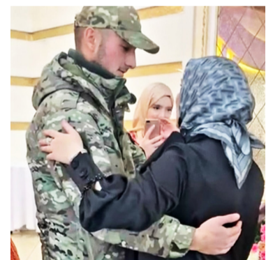
Бакълъулазул рагъулан СВООялдаса яццалъул берталъе вачлана - 2 гъум.