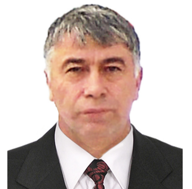
Камил Расуловасе шапакъат къуна - 2 гъум.