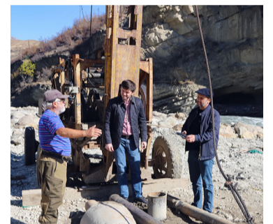
«Баклалъулаб байбихъи» программа нухдаинабизе – 28 млн гъуруц - 2 гъум.