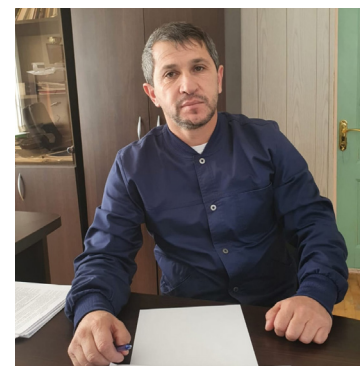
Абдулгамид Алисултанов: «Российские вакцины от COVID-19 широко применяются в мире»