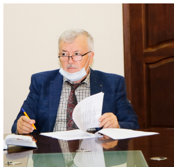
Галип Галипов провёл совещание по вопросам здравоохранения и образования