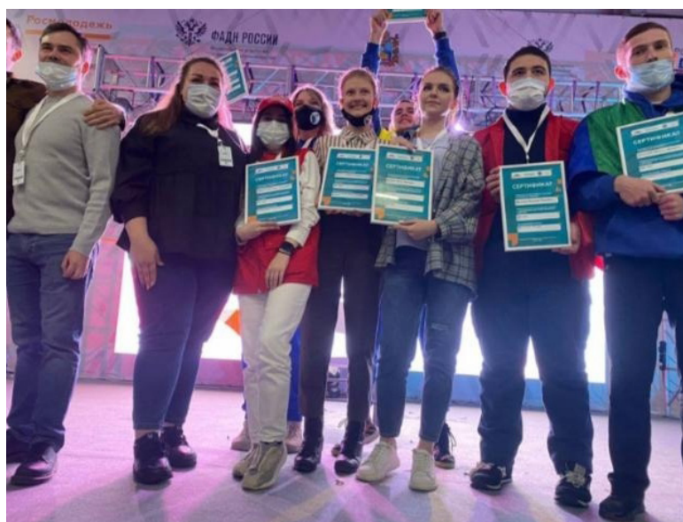
ные средства в размере 245 000 рублей и 260 000 руб

По информации источника, на проведение работы в рамках проектов они получили денеж-