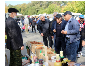
Галип Галипов посетил республиканскую сельскохозяйственную ярмарку