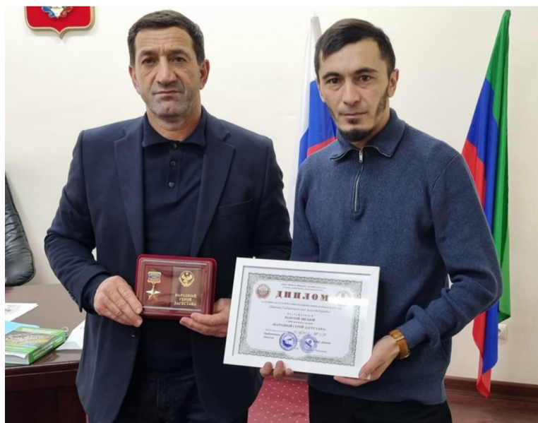
Спецоперациялзул гIахъаллби, «Бихъинчилъиялзул гIахъаллби» медалалзул кавалер, Килалъа гвардиялзул сержант

Администрациялзул ва маданияталзул вакилзабигун дандчIвана