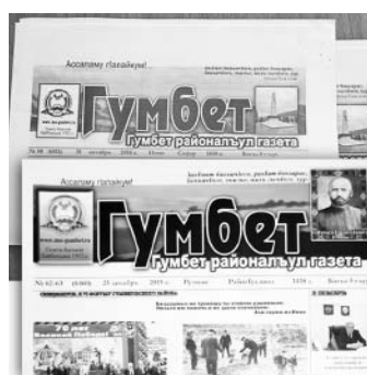
«Гумбет» басма – бакълъулазул тарих