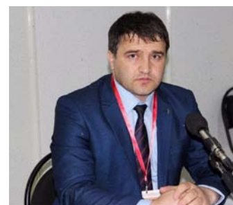
Авар Г'урухъа – Волга Г'урухъе