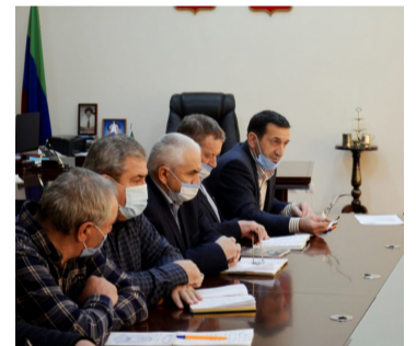
Росаби церетей – аслияб масъала