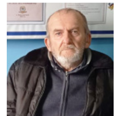
Аргъваниса Нурмухаммадовасул гурмурудул нух