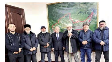
«Дир Дагъистан – дир нухалъ»