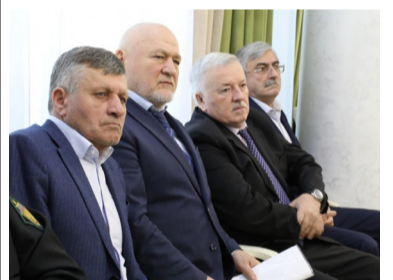
Бакълуазул тІалъи – ФСБялул вакил ГІахъалъараб данделъиялда