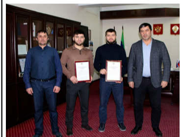
COVID-19 унтуда данде къеркъаралъухъ