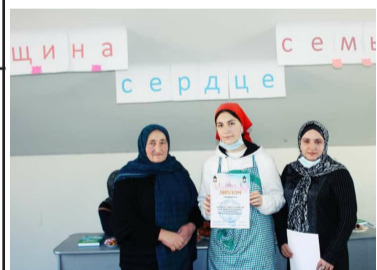
«Чужугъадан – хъызаналъул ракъ»