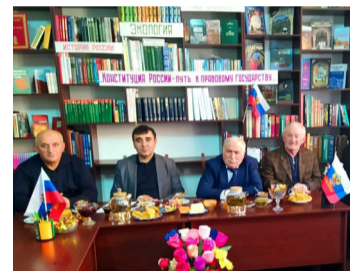
Бакълъулазул районалда Россиялъул Конституциялъул къо кюдо гъабуна