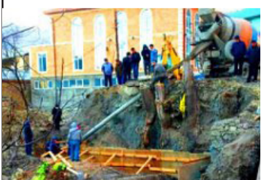
Килалъ росулъ къачалел буго мажгиталъул азбар