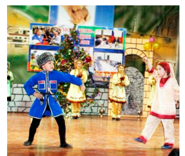
Маданияб гІалаб тІобитІулага