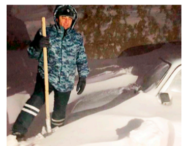
ХІариб мегІералъул асирал