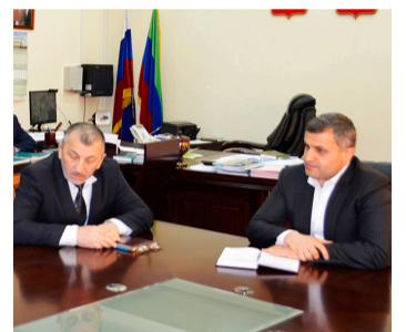
Афгъаналъулазе кумек, нухлулал хвасар гъари, араб соналъул хІасилал