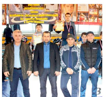
Зулмуялде дандечІеялъул ахІиялда гъоркъ