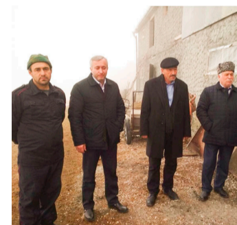
Грантги щвана, 42 гектар ракъул ижараялъеги босана