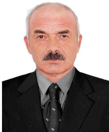
бачана онкологияџул тохтир-

1985 соналџ Хадис хлăлтџизе вачлăна Гумбет районџул центриџаб больницаџул оториноларинголог мащалил тохтирлџун. 2005 соналда тана поликлиникаџул нухмалџулевлџун. Цадахџго