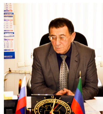
Гъаракъ кьезе бугеб ихтияр